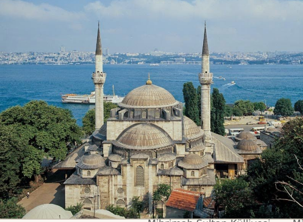
Mihrimah Sultan Külliyesi — Mimar Sinan'ın Üsküdar'daki şaheseri

Gezimiz Üsküdar'dan başlıyor. Boğaz kıyısı boyunca yol alıp Paşalimanı ve Fethi Paşa Korusu üzerinden Kuzguncuk sokaklarını keşfe çıkacağız.