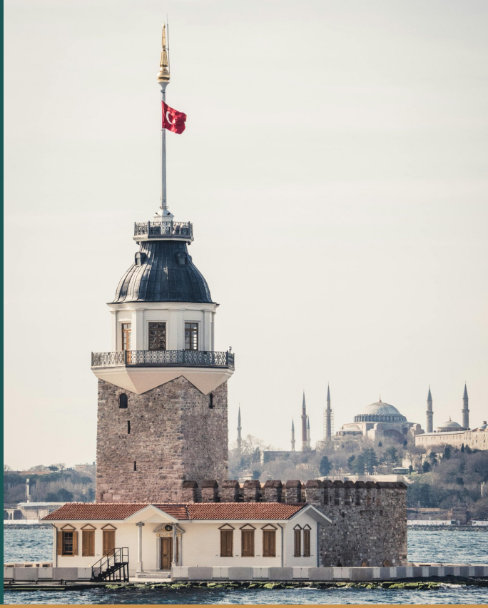
Üsküdar'dan Kız Kulesi ve Tarihi Yarımada manzarası