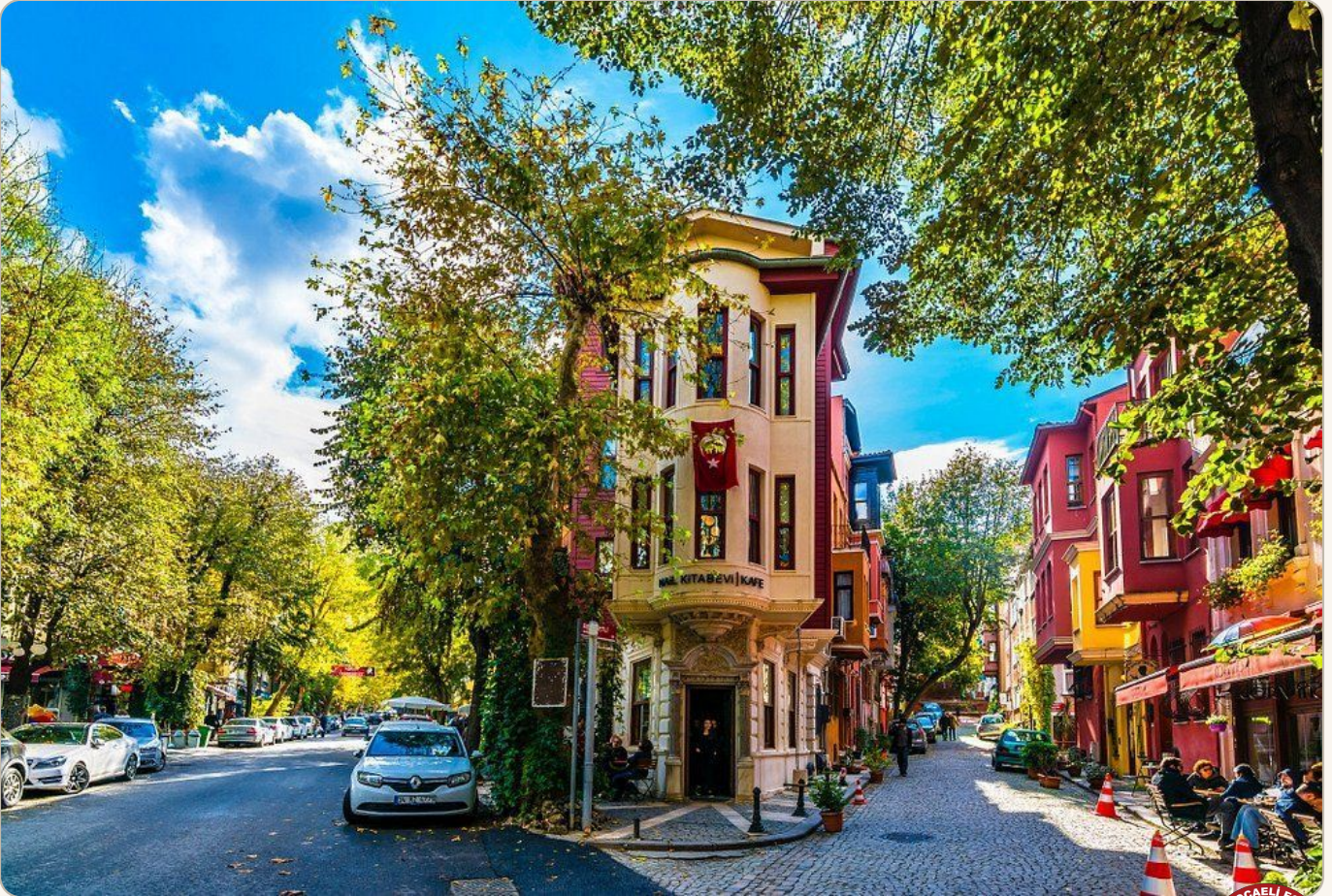
Kuzguncuk — İstanbul'un en renkli sokakları

Artık Kuzguncuk sokaklarındayız. Tarihi dokusunu koruyan bu mahallede cami, kilise ve sinagoglar yan yana yaşamaya devam ediyor. Bu bir arada yaşam geleneği, Kuzguncuk'u İstanbul'un en özel köşelerinden biri yapıyor.